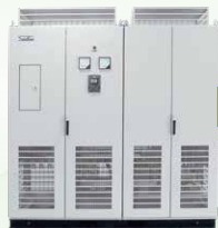
双机并联型柜机 DB06系列

变频器结构设计巧妙，小巧的体积和重量有效节约安装空间；单机壁挂式变频器功率密度高达963kW/m 3 ，实现新突破，打造超高功率密度。